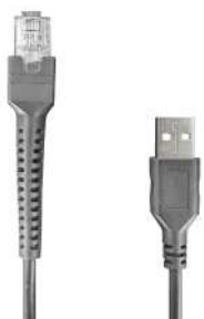
Cabo USB removível