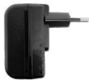
Adaptador de energia