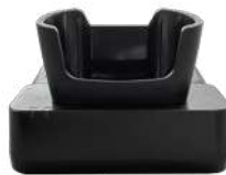
Berço de carga