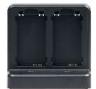
Carregador gang 4 posições de bateria para K1 Cold Long Range