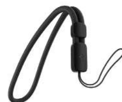
Alça de pulso